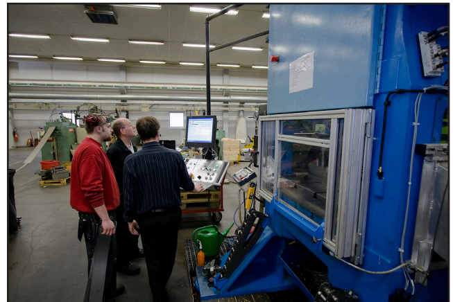
Nu står Famecos 125 tons fyrpelarpress åter på plats i Skillingaryd efter renoveringen på SMV Industrier i Smålandsstenar.